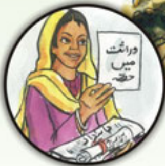
قرضوں، زمین کی ملکیت اور جائیداد کے حصول تک رسائی