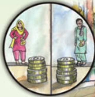
معاوضے میں برابری