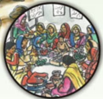
مختلف ہنر میں تربیت

مصنوعات کی فروخت کے ذرائع اور رابطوں تک رسائی